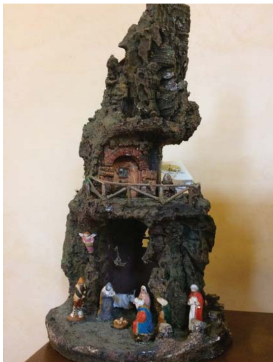
Presepe tipo B - € 100,00

Via San Gregorio Armeno è una strada del centro storico di Napoli celebre per le botteghe artigiane di presepi. La tradizione presepiale risale alla fine del XVIII secolo, ma ha un'origine remota: in epoca classica, esisteva, in quella strada, un tempio dedicato a Cerere, alla quale i cittadini offrivano, come ex voto, delle piccole statuine di terracotta fabbricate nelle botteghe vicine.