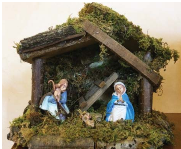
Presepe tipo A - € 35,00

Via San Gregorio Armeno è una strada del centro storico di Napoli celebre per le botteghe artigiane di presepi. La tradizione presepiale risale alla fine del XVIII secolo, ma ha un'origine remota: in epoca classica, esisteva, in quella strada, un tempio dedicato a Cerere, alla quale i cittadini offrivano, come ex voto, delle piccole statuine di terracotta fabbricate nelle botteghe vicine.